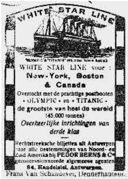
Advertentie in Het land van Aelst van 21 april 1912, de Titanic lag toen al zes dagen op de zeebodem