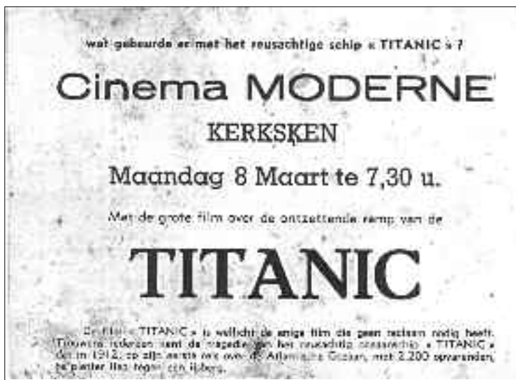
Film Titanic, vertoning in Kerksken op maandag 8 maart 1954

'Titanic' de film van 20th Century Fox ging in première op 11 april 1953. De film opende met de mededeling dat alle gesprekken met betrekking tot de navigatie van het schip origineel waren. Het was de eerste film over de scheepsramp die uitvoerig in de media kwam.