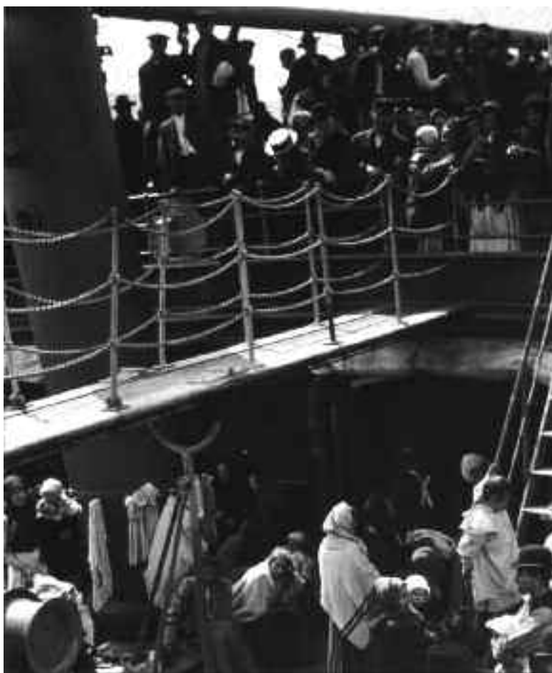
Foto 1907. Tussendekspassagiers

Voor het vertrek in Antwerpen volgde nog een medische keuring. Zwangere vrouwen werden geweigerd. Wie leed aan ontsteking aan de oogleden (trachoom), hartaandoening, schimmelsziekte op de hoofdhuid, longproblemen, kropgezwel en vermoedelijke of onmiskenbare geestesziekte maakten geen kans en werden geweigerd.