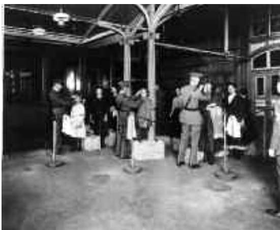
New York, Ellis Island medische controle van de ogen.

Veel emigranten gingen een nieuw succesvol leven tegemoet, voor talloze anderen was het hele avontuur een zware ontgoocheling. Landverhuizers worden bij aankomst gekeurd, gewikt en gewogen