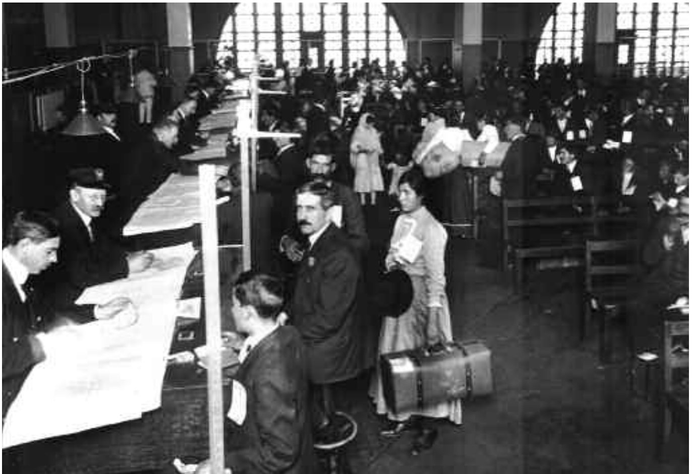
Ellis Island, aanmelding, beantwoorden van de vragen en registraite.

Na de controle op Ellis Island ging het met de ferry naar het vlakbij gelegen New Jersey, van waar met de Pennsylvania Railroad naar Detroit.