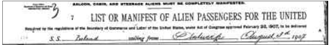
Detail uit het scheepsmanifest van SS Zeeland. Vertrek Antwerpen 3 augustus 1907, aankomst New York Ellis Island 13 augustus 1907.