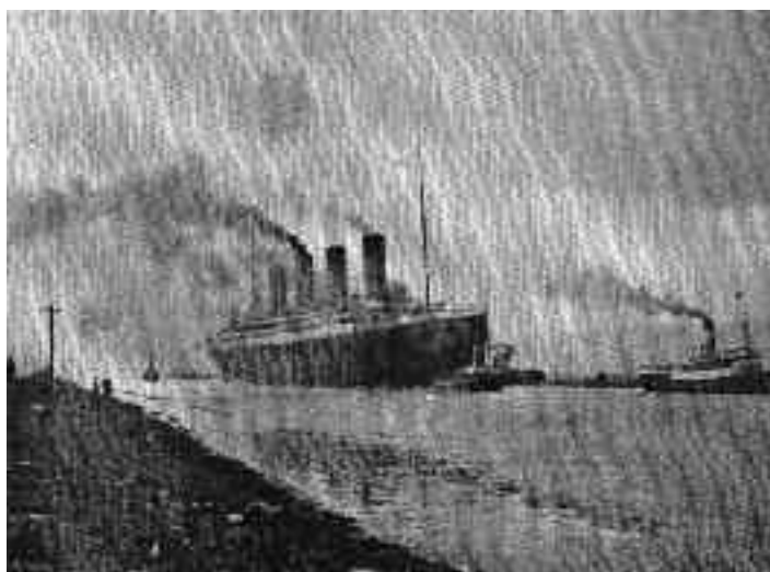
10 april 1912, onder begeleiding van sleepboten verliet de Titanic de haven van Southampton.

De nachtelijke overtocht bracht de passagiers van Antwerpen naar Harwich en verder per trein naar Londen. De nacht van 9 op 10 april verbleven zij in het Waterloo Station. Ze sliepen er boven op hun bagage. Op woensdag 10 april vertrok uit Waterloo Station Londen om 7.30 uur een speciale Titanic-trein voor tweede- en derdeklas passagiers naar Southampton. Vóór het vertrek volgde het geneeskundig onderzoek.