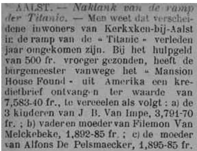
'Den Denderbode' van 9 februari 1913